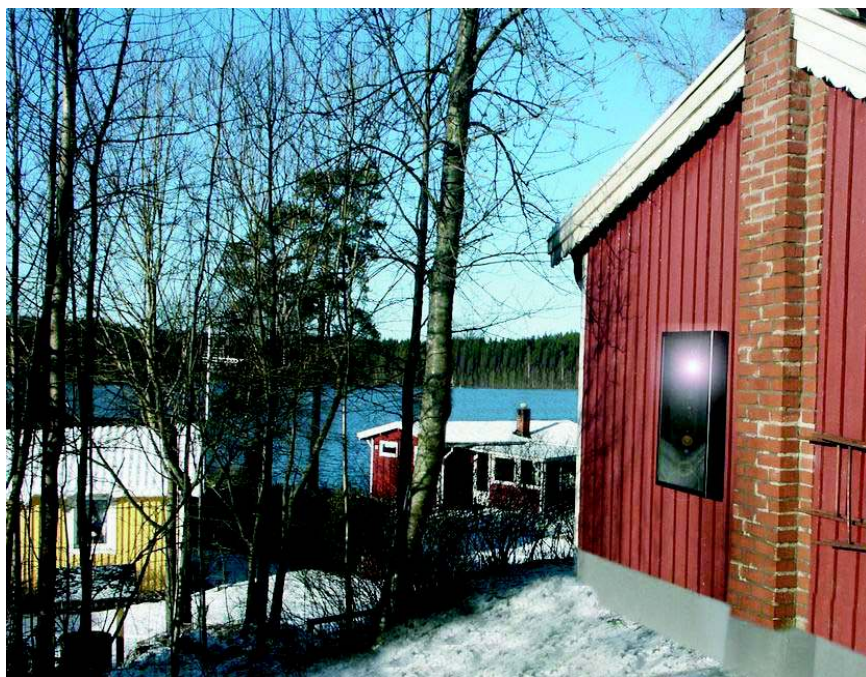
SolarVenti SV7 på gaveln till detta trähus håller det friskt och torrt.

Aidt Miljø A/S grundades 1981 med produktion av vätske solvärmeanläggningar och har sedan 1985 framställt luftsol-värmeanläggningar, i synnerhet till fritidshus- och stugor. Dessa har visat sig ha ett mycket stort användningsområde, ända från Spanien i söder till Grönland i norr, och från Irland i väster till Nya Zeeland i öster. Under 2006 har namnändring skett till SolarVenti A/S .